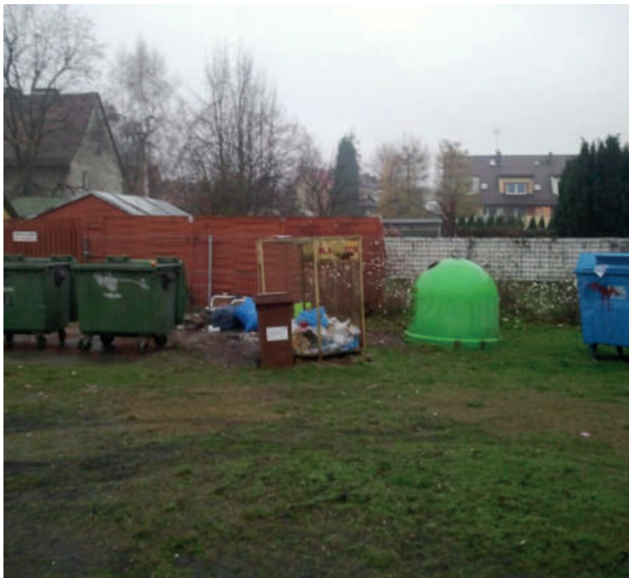
Jeden ze śmietników na naszym osiedlu