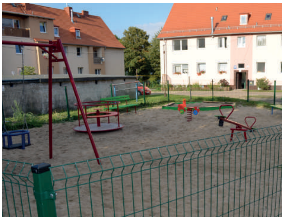
plac zabaw dla dzieci na podwórku pomiędzy posesjami Boh. Westerplatte 23-25-27 i Odrzańska 20-22-24.

Od złożenia ślubowania radnego na początku kadencji, do dziś złożyłem w sumie 47 interpelacji i wniosków do Burmistrza Polic w sprawach dotyczących mieszkańców Gminy. Opracowałem i przedłożyłem trzy propozycje programów.